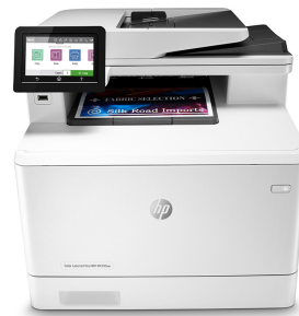
HP Color LaserJet Pro M479fnw

Printer die dynamische beveiliging ondersteunt. Alleen bedoeld voor gebruik met cartridges met een originele HP chip. Cartridges met een niet-HP chip werken mogelijk niet en cartridges die nu werken, zullen mogelijk in de toekomst niet werken. Meer informatie op: http://www.hp.com/go/learnaboutsupplies