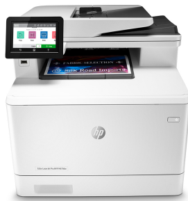
HP Color LaserJet Pro M479dw

Winnen in het bedrijfsleven betekent slimmer werken. De HP Color LaserJet Pro MFP M479 is ontworpen om u te laten focussen op de meest effectieve manier om uw bedrijf te laten groeien en de concurrentie voor te blijven.